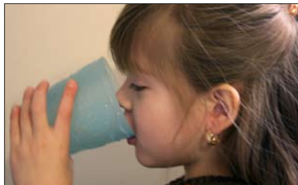
7. Enjuáguese la boca con agua y ESCUPA