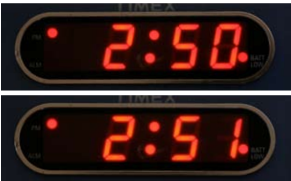
Si necesita otra inhalación del medicamento, espere UN minuto. Después repita los pasos 4 a 6