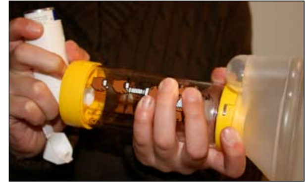
3. Únalo al espaciador