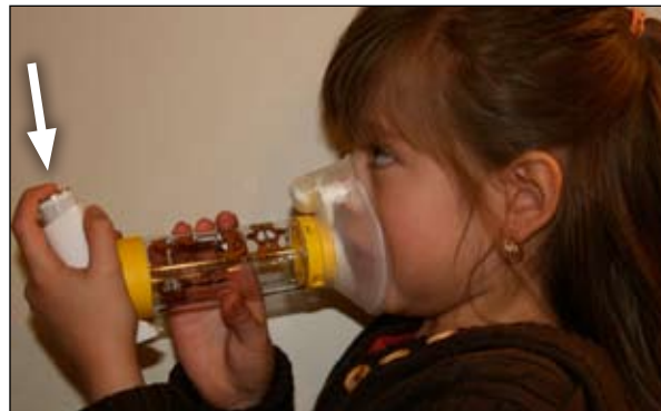
5. Apriete aquí hacia abajo. Eso hace que entre medicamento al espaciador