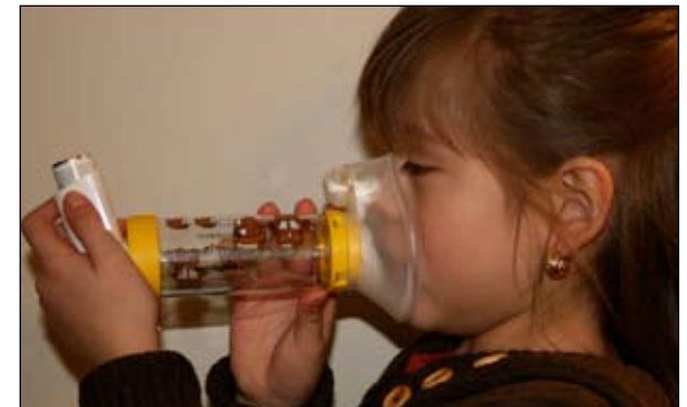
6. Inhale y exhale seis veces