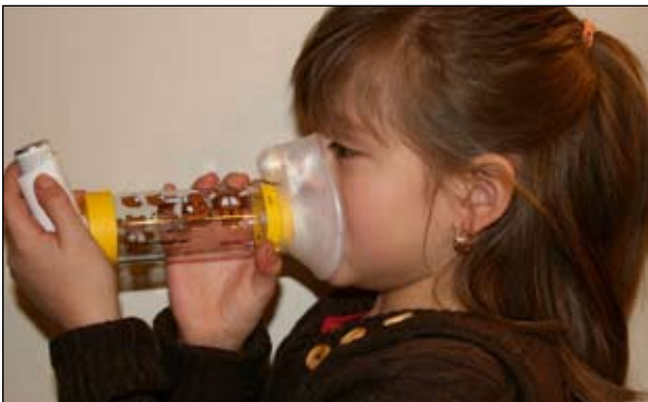
4. Derecho y póngase la mascarilla sobre la nariz y la boca