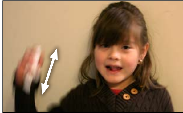
2. Agite el inhalador